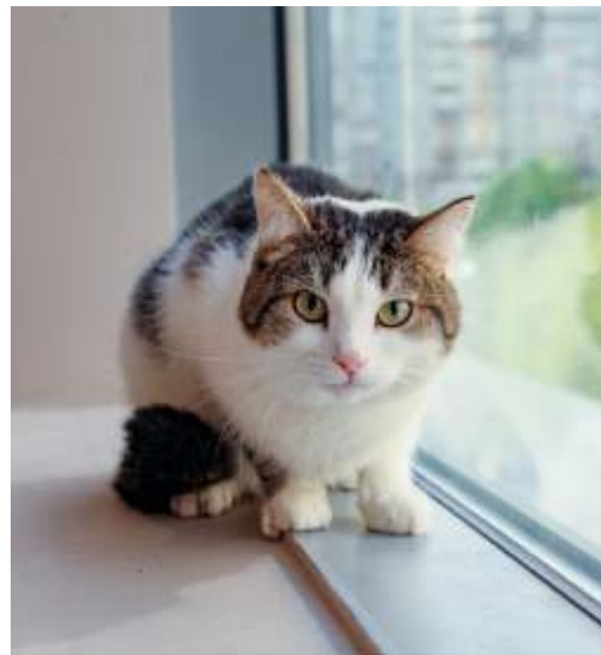
Кот Ю Сын Хо

Фотография из альбома "Они нашли свой дом"