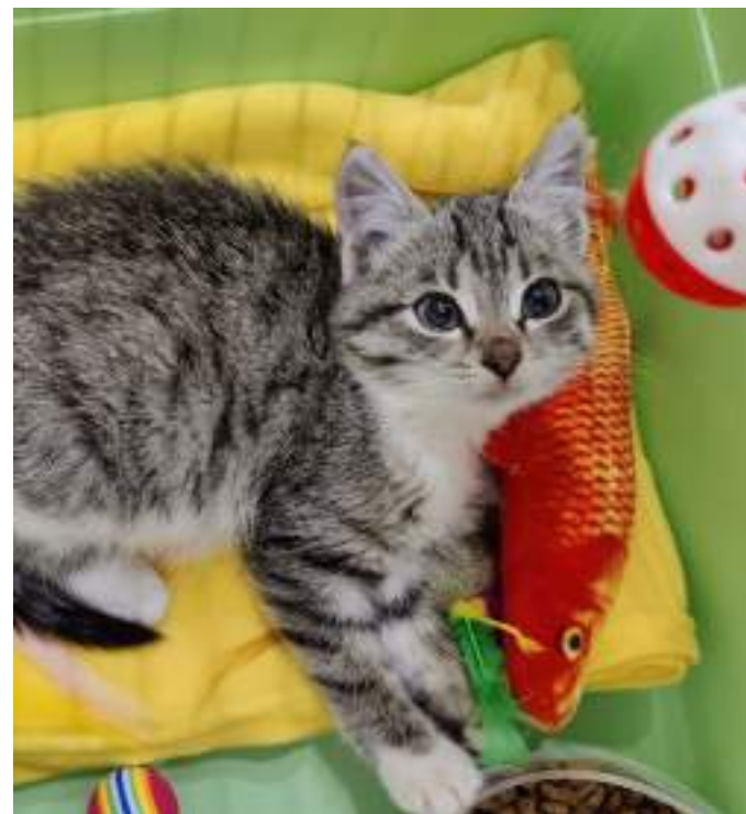
Кошка Брусника со сливками